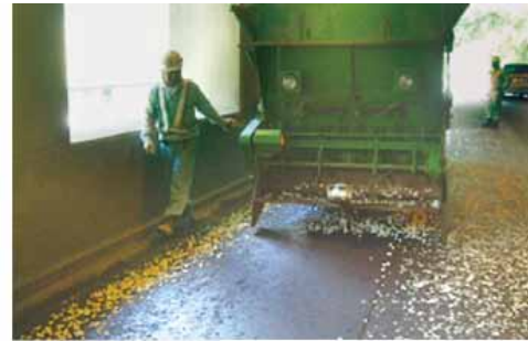
フレコートチップ散布