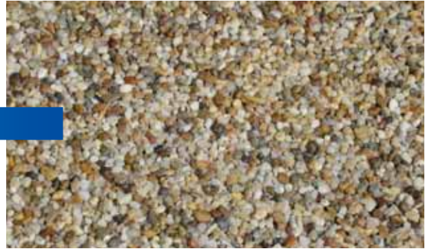
天然砂利 淡路砂利