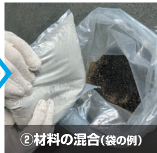
②材料の混合(袋の例)