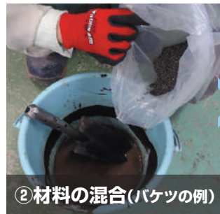
②材料の混合(バケツの例)